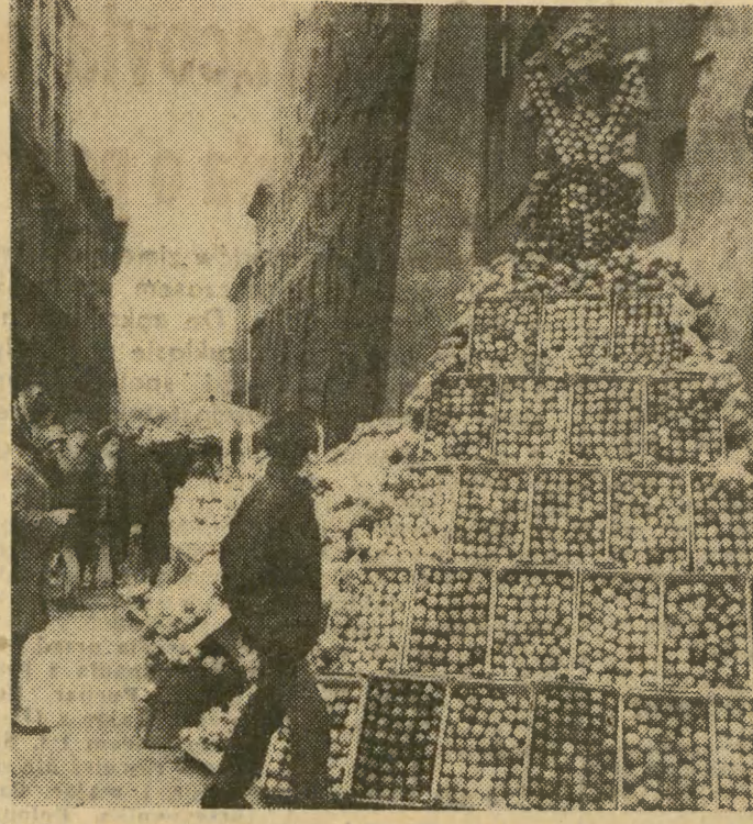
Trzeba przyznać, że krakowski handel wybitnie się ostatnio zmobilizował, jeśli chodzi o sprzedaż owoców. W wielu punktach miast odbywają się kiermasze, uruchomiono też dodatkowe stoiska ulicznej sprzedaży jabłek. Zauważyliśmy również, że w wielu kwaciarniach m. in. przy ul. Podwale, Szczepańskiej — znajdują się w witrynie gustowne siateczki, wypełnione dorodnymi jabłkami. Słowa uznania dla tych przedsiębiorstw handlowych, które doceniły akcję wielkiej jesiennej sprzedaży owoców! Na zdjęciu: kiermasz przy ul. Siennej.

Przedstawiciele Kuratorium, ZNP, wydziałów oświaty a także nauczyciele z poszczególnych krakowskich szkół — złożyli wczoraj wieńce na Grobie Nieznanego Żołnierza, Grobach Żołnierzy Radzieckich k. Barbakanu oraz na miejscach straceń Polaków przez hitlerowski okupant, m. in. przy ul. Lubicz, w Płaszowie, na Wzgórzach Krzesławickich. Uczniowie udali się też na krakowskie cmentarze, by złożyć kwiaty na grobach zasłużonych nauczycieli.