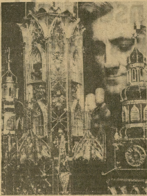
roczny konkurs szopek odbędzie się 5 grudnia.

MOSKOWICZE NA ELBRUSIE Nowy model samochodu osobowego „moskwicz-412” budzi ogromne zainteresowanie. Ma to być bowiem samochód, który nie zawiedzie nawet w najtrudniejszych warunkach terenowych. Potwierdzają tę fałm próby praktyczne modelu „412”, który dojechał z powodzeniem do wioski Terskop, położonej na zboczu góry Elbrus na wysokości 3,5 tys. metrów.