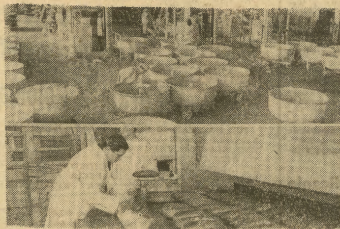
Jak już informowaliśmy, wczoraj uruchomiona została w Krakowie-Czyżynach przy ul. Centralnej 29 nowoczesna, całkowicie zmechanizowana piekarnia. Za-

Od dziś zatem — nowa, piękna ekspozycja przyciągać będzie na Wawelskie Wzgórze dodatkowe rzesze turystów. (2s)