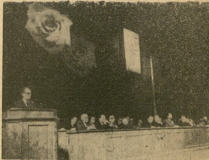
IV Krajowy Kongres ZBoWiD. Na zdjęciu: fragment prezydium obrad. Referat sprawozdawczo-programowy wygłasza Mieczysław Moczar.

O godz. 9.15 Kongres wznowił obrady. Toczy się nadal dyskusja plenarna, a ponadto