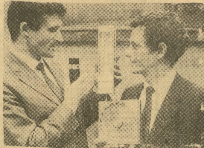
Przy okazji IV Międzynarodowej Konferencji Meteorologii Karpackiej, Spółdzielni Pracy — Wytwórnia Sprzętu Zootechnicznego przedstawiła specjalistom z wielu krajów

Znaki wykonane będą techniką wielobarwną offsetu wg projektów S. Małeckiego. (TG)