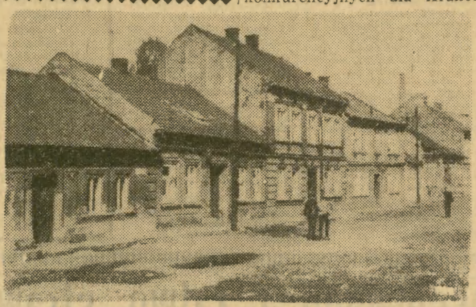
Oto domki przy ul. Spiskiej. Wiele takich ruder znajduje się na terenie podgórskiej „starówki”. Bada one sukcesywnie wyburzanie, a tereny zabudowywane na nowo, bądź przeznaczane na zieleńce.

Corocznie w całej Wielkiej Brytanii zawieranych jest ponad 440 tysięcy nowych małżeństw, z których większość — to potencjalni nabywcy nowych mieszkań. Znaczna część ludności ma mieszkania nie odpowiadające średnim standardom europejskim, nie mówiąc o wielkiej ilości slumsów w wielkich miastach. Tymczasem roczny przyrost nowych mieszkań zaledwie przekracza 400 tysięcy. Według „Timesa”, przy takim tempie budownictwa, przed rokiem 1980 nie będą zaspokojone najbardziej elementarne potrzeby mieszkaniowe ludności W. Brytanii, a zamierzenia rządu, aby liczbę mieszkań doprowadzić w najbliższych 5 latach do stanu przekraczającego znacznie liczbę rodzin — uznać można za czystą utopię.