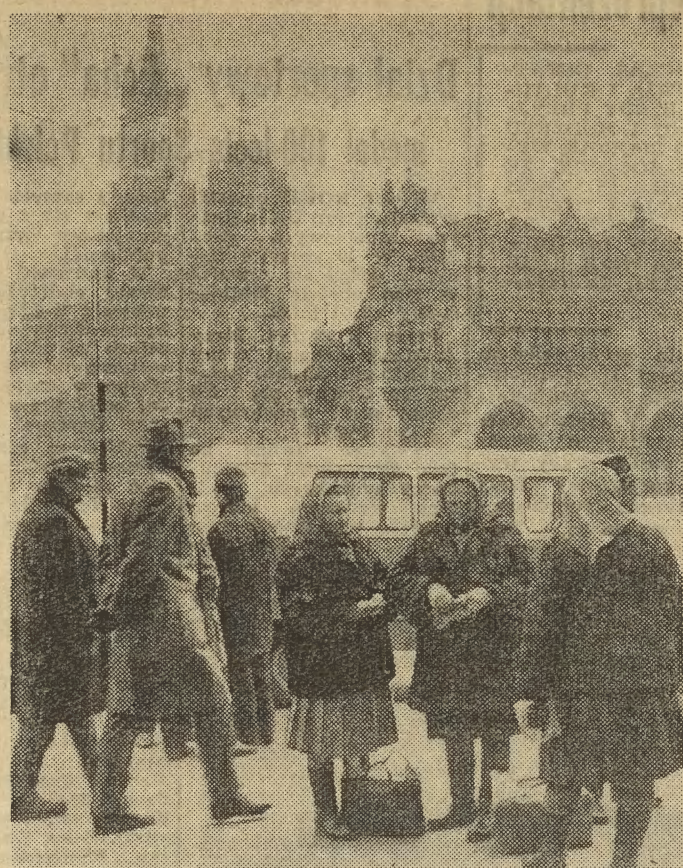
Zakup dokonano. Pozostaje teraz obliczyć kasę i powziąć dodatkową decyzję co do dalszych planów związanych ze zbliżającymi się świętami.

Załoga Przedsiębiorstwa Transportowo-Spedycyjnego Budownictwa — zgodnie z podjętym zobowiązaniem dla uczczenia V Zjazdu PZPR — wykonała 14 bm. roczny plan. Do końca bieżącego roku przedsiębiorstwo przewiezie 90 tys. ton materiałów na dalekich trasach, odcinając wydawnie PKP. Wartość ponadplanowych zadań ok. 3 mln zł.