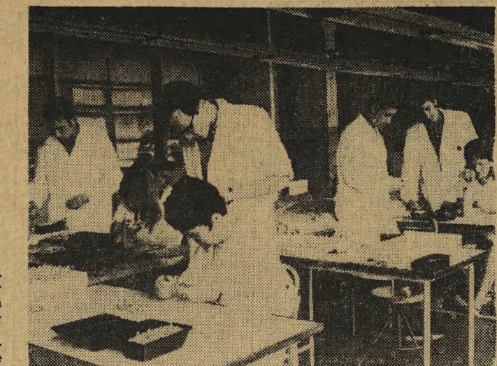
Studenci z Politechniki Krakowskiej — praktykanci w KFAP, zapoznają się z montażem drobnych elementów do aparatów pomiarowych (do art. obok).

Polacy tworzą teraz jeden z najniebezpieczniejszych (jeżeli można użyć tego przymiotnika opisując wojnę) i najbardziej dramatycznych rozdziałów w całej wojnie. W suchym języku liczb ich drogo opłacony krwią i życiem