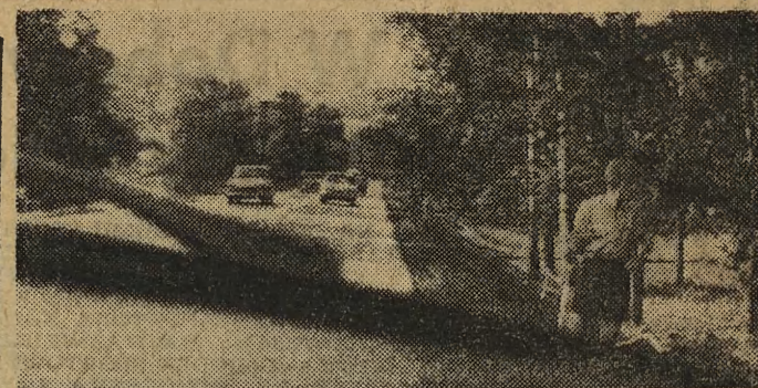
Tego lata grzyby wyjątkowo obrodziły w Polsce południowej. Mili zbieracze wychodzą więc na szosę oferując automobilistom rydze i prawdziwki. Tradycja to uprawianie malowniczo, możliwość kupienia grzybów rozwiązuje wielu wycieczkowiczom problem kolacji — ale trudna powieścić, aby ten handel nie szosie przyczynił się do wzrostu bezpieczeństwa.

ZOO (Lasek Wolski — od godz. 9 do zmroku. Ogród Botaniczny (8-20).