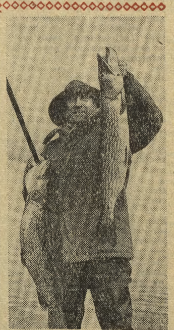
Pewnego kwietniowego poranku rybak z Wilkas k. Giżycka osiągnął niebawym sukces — na jeziorze Niegocin złapał na wędkę dwa szczupaki o wadze 6 i 8 kg.

W naszym województwie weźmie w niej udział 600 oficerów, którzy w asyście działaczy FJN, rad narodowych, organizacji zawodowych, społecznych i politycznych przeprowadzą bez mała 1200 spotkań w miastach, miasteczkach i wsiach naszego województwa. Głównym celem tej kampanii jest upowszechnienie znajomości swiętych, postępowych tradycji naszej armii, a także jej stosunku do aktualnych wydarzeń politycznych w kraju i na arenie międzynarodowej.