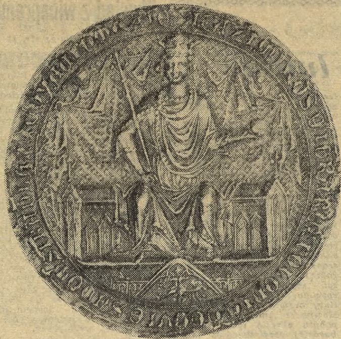
Tą pieczęcią zwaną „majestatyczną” Kazimierz Wielki opieczętował Statut Krakowskich Żup Solnych.