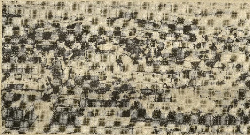
Tak wyglądało centrum Wieliczki w latach 1635—45. Model został zrekonstruowany na podstawie historycznych dokumentów, opisów i źródłowych relacji.