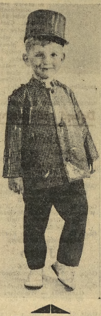
Taki oto uniform dla najmłodszych proponuje Rzemieślnicza Spółdzielczość Zaopatrzenia i Zbytu na wiosenne nieco chłodniejsze i nieco chmurniejsze dni. Trzeba przyznać, że małemu modelowi, prezentującemu wzór, jest w nim całkiem do twarzy.