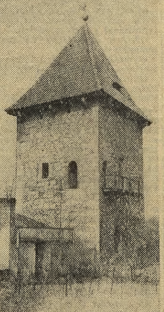
Jedna z wielkich baszt z czasów Kazimierza Wielkiego, która zachowała się po dzień dzisiejszy.

W zbiorach znajdują się okazy pochodzące nawet sprzed 3 tysięcy lat! Zostały one znalezione w grobowcach egipskich faraonów. (APN)