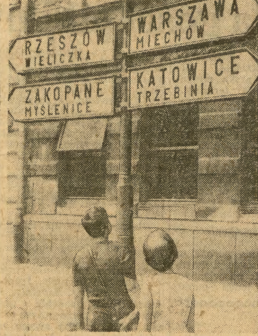
W wielu punktach miasta zainstalowano już i instaluje się nadal takie właśnie świetlne drogowskazy. — Oto jeden z nich przy ul. 1-go Maja. Fot. J. Lewicki

— W wielu punktach miasta zainstalowano już i instaluje się nadal takie właśnie świetlne drogowskazy. — Oto jeden z nich przy ul. 1-go Maja. Fot. J. Lewicki