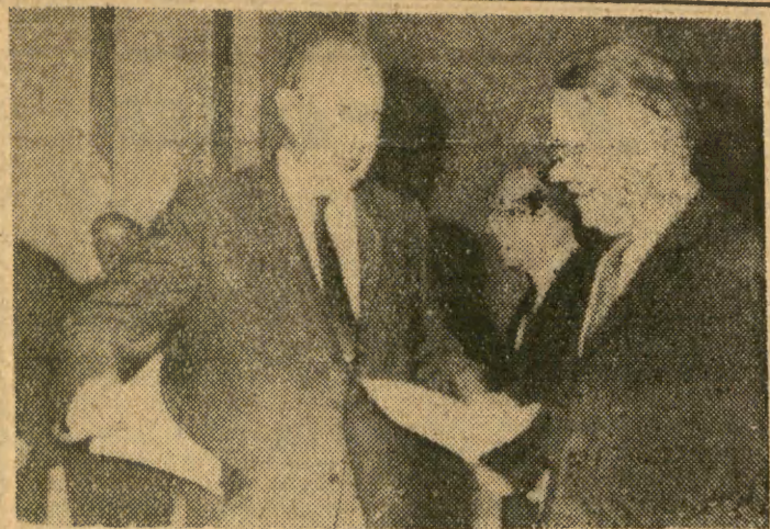
Na genewskiej konferencji rozbrojeniowej trwają dyskusje na temat traktatu o nieprolifacji broni nuklearnej. Na zdjęciu: delegat amerykański Foster wręcza część tekstu projektu traktatu delegatowi radzieckiemu — Roszczinowi.