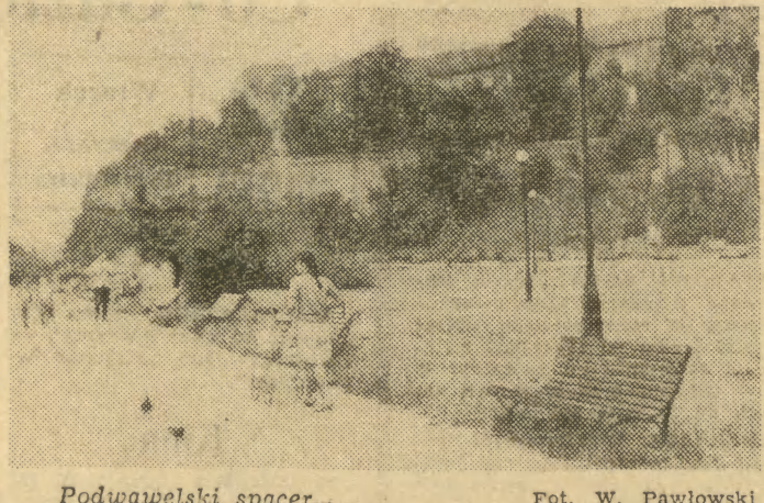
Podwawelski spacer...

Ten 15-milionowy fundusz pozwoli na przeprowadzenie prac konserwacyjnych w Murach Obronnych, Murach Kazimierzowskich, Barbakanie, Bożnicy Poppera oraz w zespole ul. Kanoniczej.