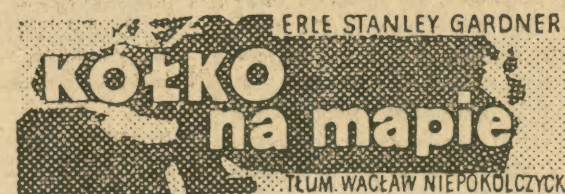
ERIE STANLEY GARDNER

— Jeśli tylko on, to dobrze. Czy mógłbyś sprawić, żeby Larkin jeszcze przez parę godzin o tym nie wiedział? „Blade” wypuściłby zaraz dodatek