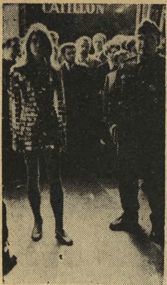
Na otwarciu wystawy diamentów w Paryżu, znana francuska piosenkarka Françoise Hardy wystąpiła w najdroższej sukni na świecie — zrobionej z czystego złota i brylantów. Na zdjęciu: panna Hardy piniowana jest przez dwóch potężnych i uzbrojonych policjantów.