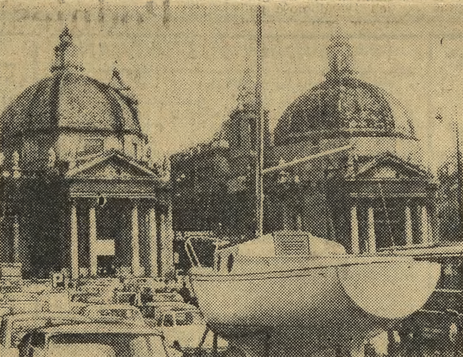
To nie trick fotograficzny — ówka rzeczywiście ustawiona jest na parkingu, na Piza del Popolo w Rzymie, z widokiem na bliźniacze kościoły Santa Maria de Montesanto i Santa Maria dei Miracoli.

Władze amerykańskie notują z niepokojem gwałtowny wzrost przestępczości w tym kraju. W 1967 roku liczba wszystkich przestępstw zwiększyła się w porównaniu z rokiem poprzednim o 16 proc. W tym kradzieże np. o 27 proc., zabójstwa o 12 proc. Wzrost przestępczości zarejestrowano wszędzie: w wielkich miastach o 23 proc., w mniejszych o 17 proc., w miejscowościach podmiejskich o 16 proc. i na wsi o 13 proc.