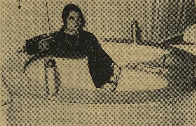
Pod hasłem „ewolucja fotela”, otwarte w muzeum plastyki użytkowej w Paryżu wystawę najdivniejszych mebli. Na zdjęciu: fotel zdecydowanie dwuosobowy, wyposażony w tranzystorowe odbiorniki: radiowy i telewizyjny oraz lampki.