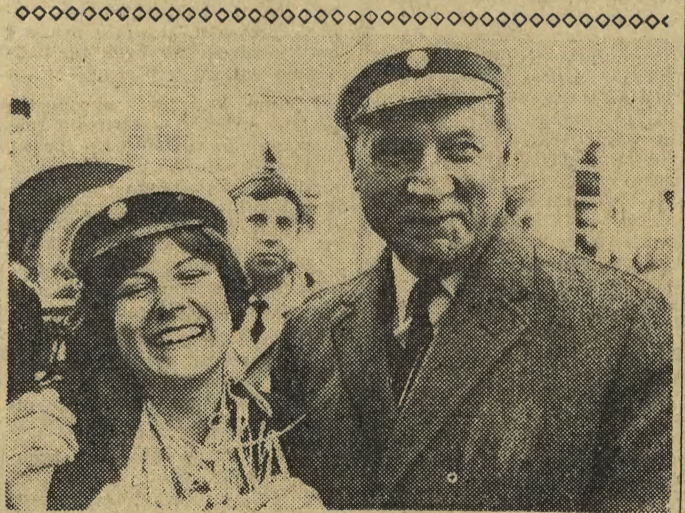
GUNNAR JARRING — PRYWATNIE

W nocy z piątku na sobotę w Tatrach padał śnieg, a w Zakopanem — deszcz. Dziś, 18 bm. o godz. 7, na Kasprowym Wierchu notowano temperaturę minus 7 st. oraz świeżą pokrywą śnieżną, grubości 15 cm. Śnieg leżał również na Krokwi i Gubałowie.