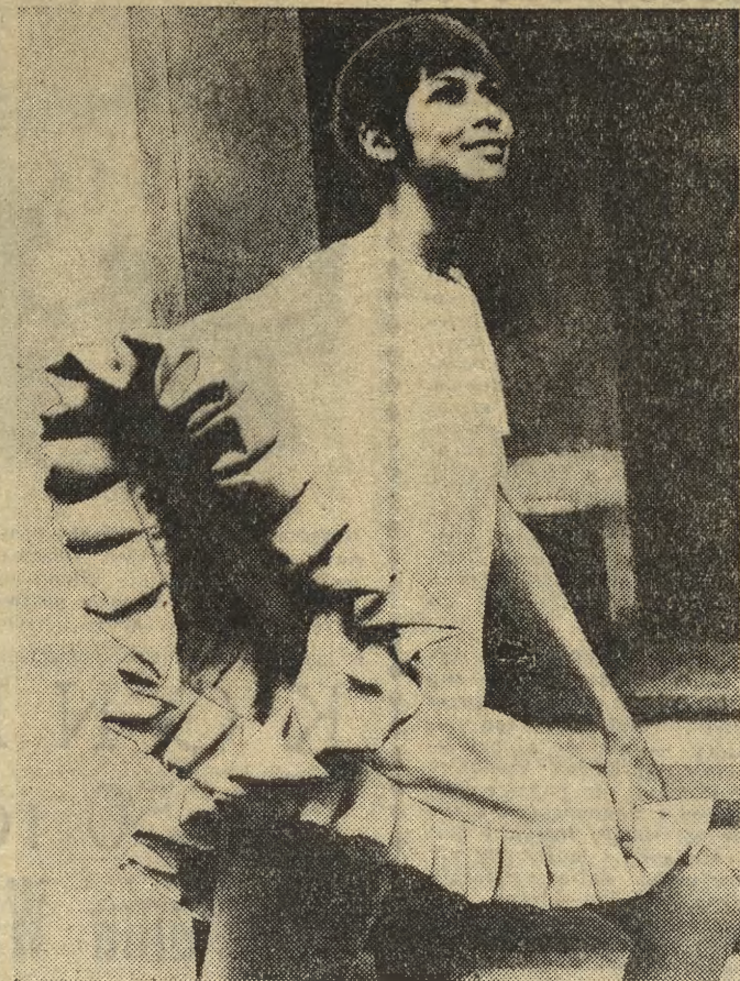
Równie niezwykły jak minimalna długość tej koktajlowej sukienki jest krój jej rękawa, przypominający skrzydła nietoperza. Rękawy przyszyte są szwem do szwa bocznego sukni, co w efekcie daje złudzenie peleryny z falbankami. CAF