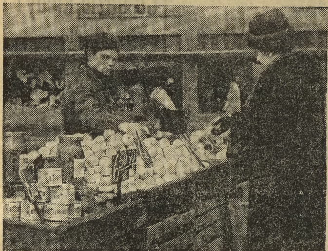
Na ulicznych stoiskach „Warzyw i Owoców” obok tradycyjnych już jabłek, cebuli czy pomarań- czy pojawiły się także konserwy warzywno-owocowe.