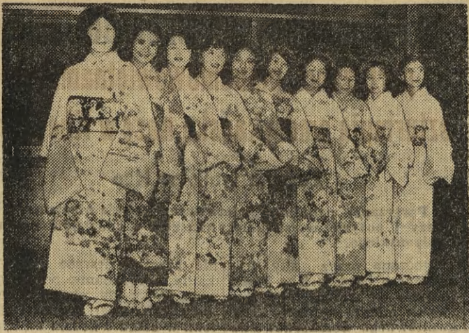
Atrakcja podróży samolotami Air France na trasie Paryż — Tokio będą uroczyste japońskie stewardessy, które zwyciężyły w zorganizowanym przez francuskie linie lotnicze konkursie.