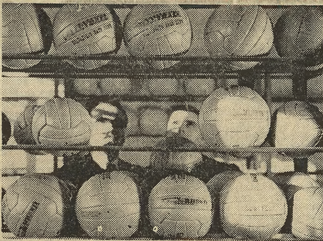
Fabryka Obuwia Sportowego w Krośnie — największy w kraju producent kilkudziesięciu rodzajów butów dla sportowców — jest jednocześnie wytwórcą piłek do gry. Na zdjęciu: regał z krośnieńskimi piłkami.

W MECZACH siatkówki mężczyzn o mistrzostwo I ligi GKS Katowice przegrał z Hutnikiem Nowa Huta 2:3 (10:15, 12:15, 15:13, 15:12, 15:17), a Stal Mielec wygrała z Wawelem 3:1 (15:2, 3:15, 15:8, 15:2).