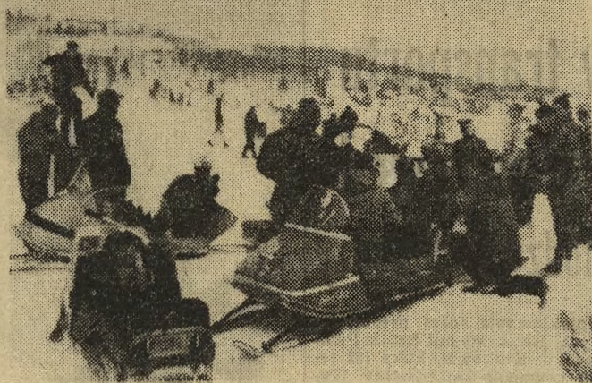
Gorączka „złota” ponownie oparowała Kanadyjczyków. Obecnie wykupują oni wielkie działki w Północnym Ontario, gdzie poszukują rud uranowych i innych