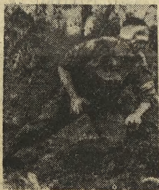
Partyzanci wlewnącej stosują bityskawicę zmiany pozycji po dokonanych atakach. Powoduje to często bombardowanie własnych wojsk przez wezwane na pomoc lotnictwo USA. Oto po ataku partyzantek w dolinie Que Son myśliwiec bombardujący typy Phantom F-4 zestrzelił helikopter amerykański, czterech członków załogi helikoptera zostało rannych. Na zdjęciu: jeden z załogi helikoptera szuka osłony przed ogniem własnego myśliwca.

Spełniliśmy Waszą prośbę i Zarząd Drogowy DOKP zawiadomił nas, że usunął awarię rurociągu, co było trudne i żmudne, gdyż uszkodzenie znajdowało się pod torami. (ol)