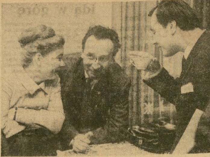
23 bm. rozpoczął w Warszawie obrady VIII Walny Zjazd Delegatów Stowarzyszenia Polskich Artystów Teatru i Filmu.

Przekazana władzom miejskim w Bagdadzie dokumentacja liczy ponad 450 stron