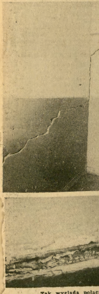
Tak wygląda połączenie ścian z podłogami w szkole w Targowisku.

Kierowniczką szkoły pokazuje nam jedną z pękniętych na wylot ścian.