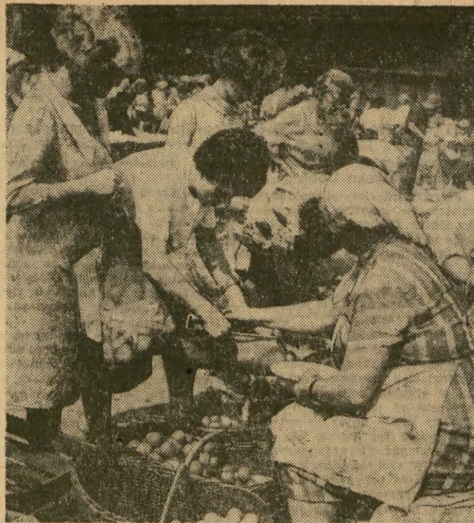
W tym roku owoce obrodziły nadzwyczajnie. Na targowiskach jest ich więc do wyboru, do koloru. Ceny są też przystępne.

ADRES REDAKCJI: Kraków, ul. Wiśnina 2, Druk: Krak. Drukarnia Prasowa, Kraków ul. Wielopole 1. T-7