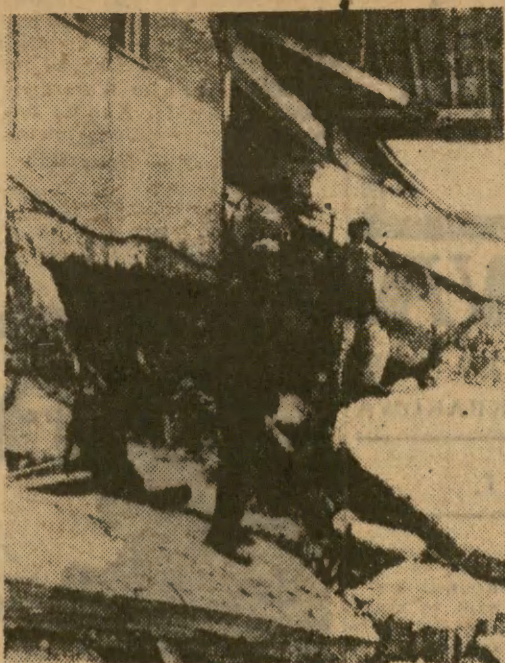
We Wschodniej Anatolii trwa akcja pomocy dla mieszkańców rejonów dotkniętych trzęsieniem ziemi. Hość bezdomnych oblicza się na 100 tysięcy. Najbardziej zniszczone miasto Varto jest w dalszym ciągu pozbawione światła. Są też trudności z zaopatrzeniem w wodę. Na zdjęciu: żołnierze tureccy pełnią służbę wartowniczą przy ruinach zniszczonego przez trzęsienie ziemi budynku banku w Varto.

Gdyby kogoś zainteresował taki domek, to warto wiedzieć, że Zakłady posiadają własny punkt usługowy, który przyjmuje zamówienia na domki, a po zrealizowaniu przysyła elementy do r. k. instruktora celem pokazania jak trzeba składać trzciniowe ściany. (bz)