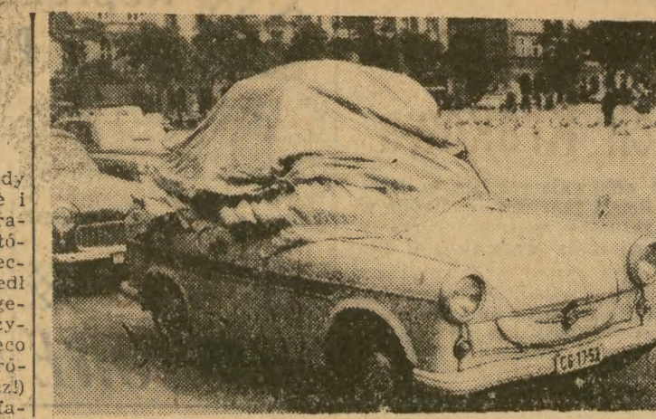
Zaradny turysta korzysta z każdej nadarżającej się okazji by wysuszyć (nawet w centrum miasta) namoknięty podczas deszczowego biwak namiot. Wystarczy rozłożyć go na dachu samochodu.

Od dziś potaniały: jabłka gorzkiego gatunku z 4 zł za 1 kg na 3,60 oraz krajowe pomidory z 4,50 za 1 kg na 4 zł i 1 zł na 2 zł.