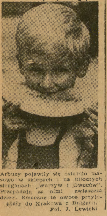
Arbuzy pojawiły się ostatnio masowo w sklepach i na ulicznych straganach „Warzyw i Owoców”. Przepadają za nimi zwłaszcza dzieci. Smaczne to owoce przyjechały do Krakowa z Bułgarii.

UTRO Kraków będzie pod wpływem niżu. Zachmurzenie zmienne z możliwością opadów deszczu. Rano zamglenia. Wiatr z kierunków wschodnich i południowych 2-6 m/s. Temperatura maksymalna 16-18 st. C.