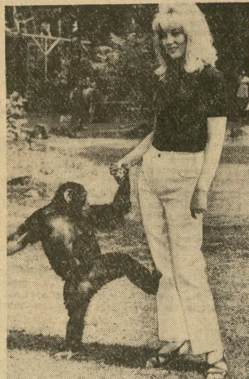
Nawet malpka Cziki z krakowskiego ZOO wykaszała duże zainteresowanie białymi dżinsami, które w tegorocznym letnim sezonie są ostatnim krzykiem młodzieżowej mody.

Krakowska Spółdzielnia Pracy Garmazeryjno-Wędlinarska była przed laty pierwszą w kraju placówką, która rozpoczęła eksport tuszki króliczej. Dzisiaj nadal zajmują się tym jej dwa zakłady w Zabierzowie i Ściejowicach. Tuszka wysyłana jest dziś do NRF, Włoch i Belgii, ok. 150 ton rocznie.