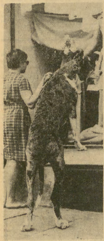
Pies też chce wiedzieć z jakiego materiału jego pani ma zamiar uszyć sobie sukienkę.

Niezależnie od tego, że mogłoby to znacznie zwiększyć nasze zasoby kwaterunkowe, wprowadziłoby też element pewnej konkurencji, zawsze korzystnie wpływającej na poziom usług. Wszelkie monopole mają skłonność do lekceważącego traktowania swoich klientów, feudalnie brzmiące hasło „nasz klient — nasz ojciec”. (Jest to tylko uwaga natury ogólnej, klienci „Wawel-Touristu” są na szczęście starannie obsługiwani i na ogół bardzo zadowoleni). Trzeba jednak podkreślić, że organizując nową sieć kwater prywatnych, należałoby rzeczywiście zwerbować zupełnie nowych właścicieli mieszkań, a nie dzielić to, co już zostało zagospodarowane przez „Wawel-Tourist”. (j)