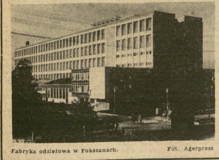
Fabryka odzieżowa w Fokszanach.

„Jesteśmy przekonani — głosi m. in. depesza — że współpraca i przyjaźń między naszymi narodami będzie się stale rozwijać dla ich dobra, w interesie jedności krajów socjalistycznych, socjalizmu i pokoju”.