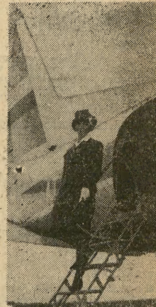
Święto Lotnictwa, to także uroczystość lotnictwa państwa. Na ręce uroczystych stewardess składamy z okazji ich święta, życzenia wszystkim lotnikom.

W rozkazy czytamy m. in.: Wasze osiągnięcia i wasz codzienny ofiarny wysiłek stanowią o tym, że lotnictwo Polski Ludowej, wyposażone w najnowocześniejszy sprzęt, złożone stale pogłębiającym się braterstwem broni z siłami powietrznymi Armii Radzieckiej i wszystkich państw Układu Warszawskiego, jest mocnym i niezawodnym ogniwem w systemie obronnym naszego państwa