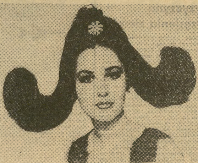
CZY SIĘ PRZYJMIE...?

Przewodniczącemu Rady Państwa nadano godność honorowego stoczniowca Stoczni Gdańskiej, a także wręczono medal pamiątkowy i model nowego trawlera-przewodni, pod który w tym samym dniu położona została stępka.