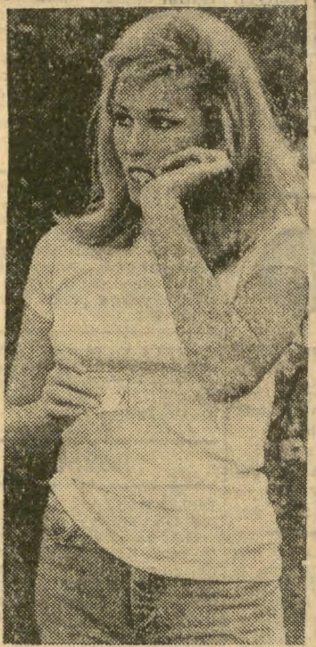
Ursula Andress — zdaniem znawców najatrakcyjniejsza dziś gwiazda i kobieta światowej kinematografii