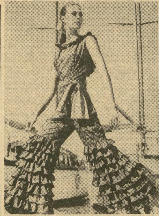
Na ostatnie tygodnie lata proponujemy naszym odważniejszym Czytelnikom taki atrakcyjny strój na plażę: z popeliny w drobny wzorek kwiatowy, szarfa jednobarwna w kolorze kwiatków.

Listę nazwisk moglibyśmy mnożyć w nieskończoność zważywszy, że obecnie Związek Polskich Artystów Plastyków liczy około 6 tys. członków, a jego sekcja malarstwa (przewodniczący Stefan Gierowski) około 2 tys. osób. Gdyby więc się pokusić o wymienienie tylko plastyków najbardziej znanych i uznanych, którzy tworzą i działają jak Polska długa i szeroka, powstałaby chyba książka.