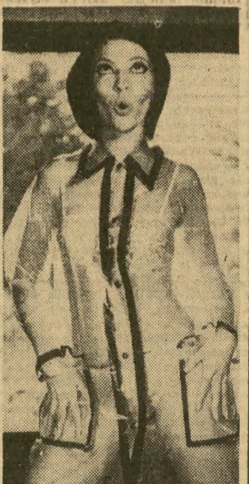
Dunki wybierając się na plażę muszą być przygotowane również na ulowę — stąd kostium „bikini” pod płaszczem (przeźroczystym) od deszczu.

Niektórzy uważają, że ten pierwszy to jest prawdziwy turysta, a drugi — to intruz, barbarzyńca, który zupełnie niepotrzebnie przyjechał w