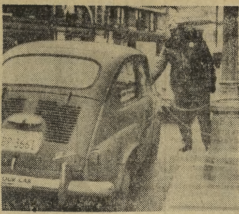
Pomysłowy posiadacz małego „Fiata” w mieście Chattanooga w amerykańskim stanie Tennessee przykuł swój samochódzik łańcuchami do latarni i kraty ścieku ulicznego. Miało to uniemożliwić porwanie samochodu przez miejscowych policjantów, którzy ściągają z ulic miasta samochody niedostatecznie zabezpieczone przed złodziejami.