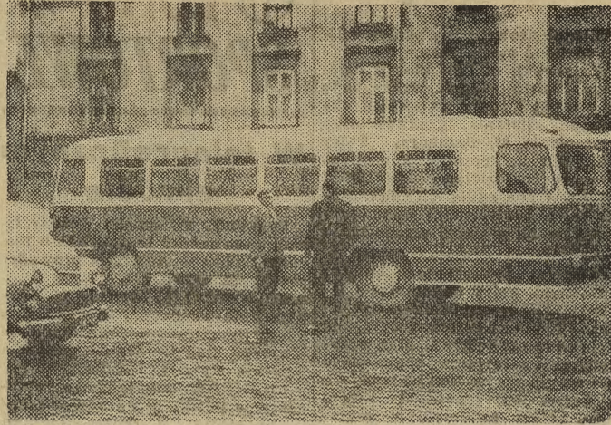
Tym razem ograniczono się do pouczenia: na Małym Rynku mogą parkować tylko samochody osobowe. Zaparkowany, jak to widać na zdjęciu, autobus zastłania bowiem całkowicie widoczność na ruchliwe skrzyżowanie. O tym kierowca spoza Krakowa nie pomyślał, a znaku mówiącego o zakazie parkowania — nie zauważył. Musiał więc za radą sympatycznego funkcjonariusza MO wycofać się z obranego miejsca postoju.

Różne zarządzenia naszego handlu przestały nas już dziwić, nad niektórymi kwiemy głowami i idziemy dalej. To też nie dziwi nas zupełnie, że w okresie największego ruchu przedświątecznego jedyny sklep papierniczy — ozdoby choinkowe i zabawki — przy ul. Karmelickiej 60 był w dniach 21 i 22 zamknięty z powodu remanentu, ani nawet to, że 27 bm. po świętach z tych samych powodów w „Delikatesach” w Ryнку Gł. nie można było kupić kawy... (ol)