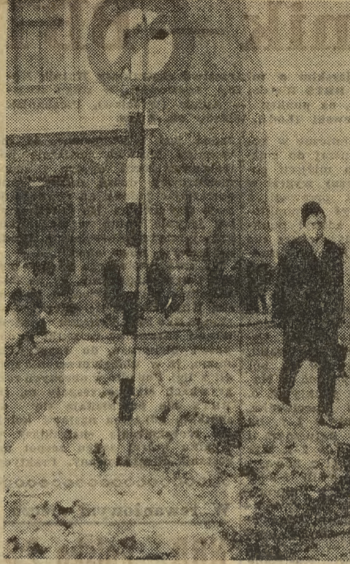
MPO liczyło wi- docznie na od- wili, spodziewa- jąc się, że ta wymiecie rady- kalnie zwal- ńnięgu z ulic miasta. Tymcza- sem śnieg zmie- nia się sukcesy- wnie w błoto, a przejeździe Rynku Gł. równa się przebrnięciu - przez jedną wiel- ką kałużę.

Pralkę, zgodnie ze słabym zapotrzebowaniem rynku, wypro-