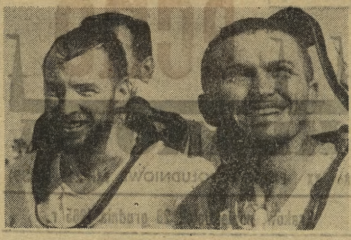
Astronauci Lovell (z lewej) i Borman na pokładzie lotniskowca „Wasp“. Na twarzy Lovella widoczny dwutygodniowy zarost. Borman podczas lotu gołił się specjalną żyłką.

W trosce o szybkie zebranie pieniędzy na konserwację i budowę nowych dróg, władze lokalne na wyspie Jersey (W. Brytania) wprowadziły podwyższony podatek od samochodów. Cały dowcip polega zaś na tym, że wysokość tej daniny zależy będzie od... długości samochodu.