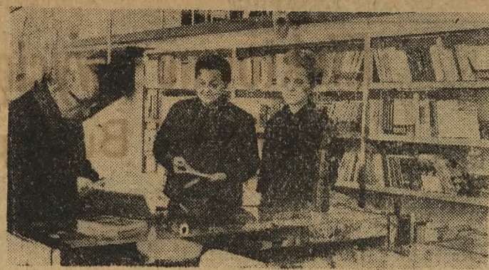
Księgarnia „Domu Książki” otwarta w hotelu „Cracovia”. Cieszy się dużym powodzeniem wśród krakowskich czytelników. Można tu znaleźć ciekawe nowości wydawnicze.

Zanim listę odmian drzew owocowych zalecających do uprawy w danym rejonie kraju wzbogaci się o nową pozycję, trzeba dokładnie zbadać przydatność „najbardziej nawet zachwalanej „nowości”, czyli sprawdzić jak jej odpowiadają miejscowe warunki glebowe i klimatyczne, czy nie traci odporności na mróz i choroby, czy plonuje równomiernie. Jedne odmiany zdają ten „egzamin” cesując, w wyniku czego upowszechnia się ich uprawę w sadach handlowych. Co do innych, specjalści mogą wysuwać pewne zastrzeżenia, jeśli jednak ujemne cechy równoważą walory dodatnie (np. zmniejszoną odporność — wymieniony smak owoców) to nie należy one miejsce w małych amatorskich sadach i ogródkach przydomowych.