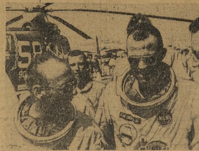
Kosmonauci Charles Conrad (po lewej) oraz Gordon Cooper na pokładzie lotniskowca „Lake Champlain”, na który przewiezieni zostali helikopterem po wodowaniu w pobliżu Bermudów.

W „Świątce Latawca” organizowanym przez „Echo”, PSS, Aeroklub Krakowski i Komendę Chorągwi ZHP białą mogą udział dzieci od 7—14 lat, oraz zajątkowo-kursowo młodzież ponad 14 lat. Zawody latawców odbędą się 26 września o godz. 10 na Błoniach krakowskich. Zwycięzcy otrzymają liczne i cenne nagrody. Uczestnicy zawodów muszą w punktach informacyjnych pobrać do dnia 18. IX karty uczestnictwa.