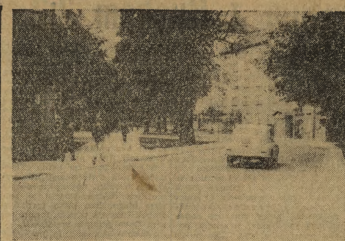
Ten właśnie zakręt przy ul. Łobzowskiej był do niedawna i dla pieszych, i dla kierowców pojazdów — bardzo niebezpieczny. Wąski chodnik i brak widoczności czy z prze-

Wydaje się, że już teraz coraz więcej ludzi w Londynie zdaje sobie sprawę z tego, że efektywnie brzmiące hasła o własnym samochodzie dla każdej rodziny czy dla każde-