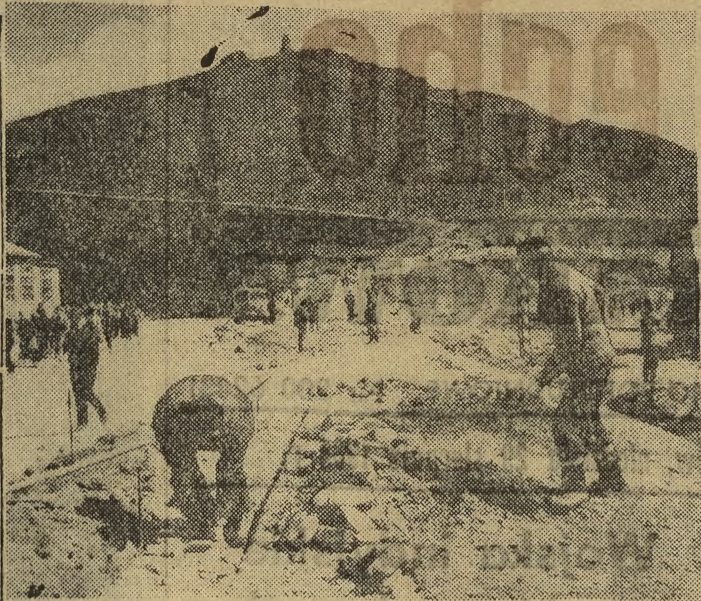
W ubiegłym roku rozpoczęta została budowa drogi — o twardej nawierzchni przeznaczonej dla pojazdów kołowych — z Bierutowa na Snieżkę. Roboty prowadzone są z obydwu stron trasy. Obecnie twarda nawierzchnia jest ułożona na stóp Snieżki na Małej Kopie. Zakończenie budowy tej potrzebnej trasy będzie równoznaczne z dalszym, znacznym ożywieniem ruchu turystycznego w Karkonoszach. Na zdjęciu: układanie twardej nawierzchni na trasie z Bierutowa na Snieżkę.

Szczególne uwagę zwrócono na budowę dróg, zagospodarowanie najbardziej atrakcyjnych zakątków Zwierzynca dla celów wypoczynku. Obecnie buduje się tu czynnem społecznym ludności i zakładów pracy ok. 12 km dróg i ulic. Goście rozmawiali z ludnością Chelma, która w sobotnie popołudnie pracowała przy budowie dróg.