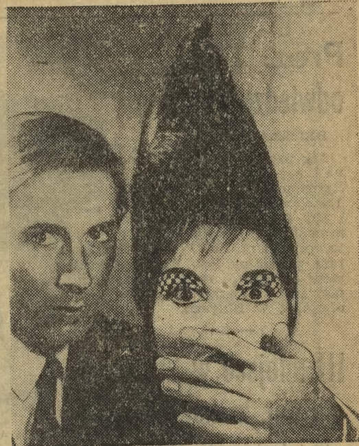
KOBIETA roku 2000...tak, jak ją sobie wyobraża „projektant twarzy” z parskiego salonu piękności.