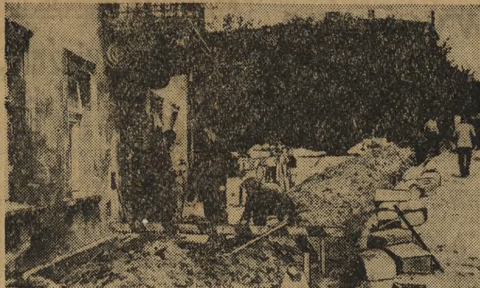
Ul. Raclawicka — trwa tu przebudowa jezdnii i chodników, zakłada się nową kanalizację. No cóż, wreszcie i ulice uchodzące za tzw. peryferyjne doczekają się jakiegogo remontu.