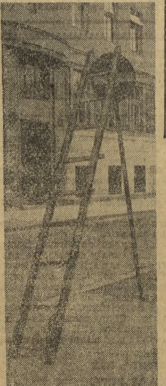
Ciekawe dokąd on wszedł po tej drabinie? — zastanawiał się nasz fotoreporter przechodząc ul. Krowoderską.

J. B. Słyszałam, że inwalidzi I grupy zwolnieni są od opłat nie tylko za radio i telewizor, ale także i za telefon. Czy to prawda? Nie, inwalidom I grupy przysługują zwolnienia od opłat tylko za radio i telewizor, opłaty za telefon muszą oni uiścić normalnie, jak wszyscy inni abonenci (mar)