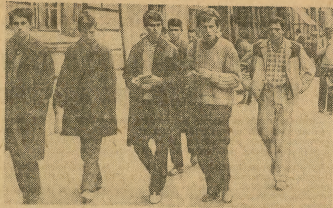
Na ulicach naszego miasta spotkać można różnorodną młodzież. Na zdjęciu: grupa młodych Węgrów.

Zasada słusznosci sportowego stylu sprawdziła się nawet na samym pokazie, bo najmniej udane były modele, w których projektanci wprowadzali jakiegoś pseudolegancie udziwnienia w rodzaju karczów sięgających do pasa lub kolorowych jedwabnych spodni. Stanowczo za dużo było modeli utrzymanych w podobno za rok najmodniejszej (skąd oni to wiedzą?) gamie brzo-miodowej i niestety ani jednej sztuki tego o czym marzą miliony kobiet bez względu na porę roku tj. miękkich cieniutkich sweterków. Poza tym pozostaje życzyć sobie, abyśmy to wszystko zobaczyli rzeczywiście w sklepach, zwłaszcza że ceny pokazywanych modeli należały do zachęcających. (bz)