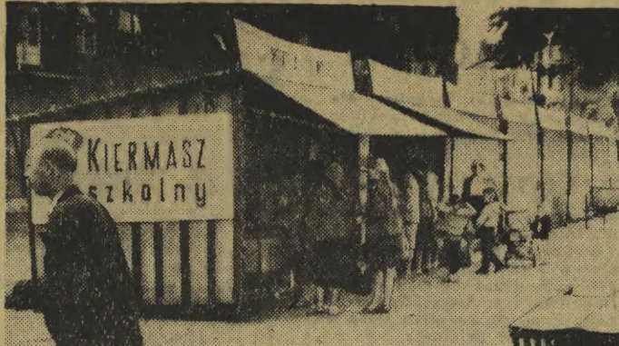
Kiermasz szkolny PSS-u na Nowym Kleparzu. Fartuchy, mundurki, teczki... No cóż, za kilkanaście dni nowy rok szkolny.

ży. Ile osób nabrała — okaże się dopiero po złożeniu przez nie wyjaśnieniu w KD MO Kraków-Grzegorzki, przy ul. Lubiec 21/7. Trudno jednak już dziś nie wyrazić największego zdziwienia wobec bezgranicznej naiwności osób poszkodowanych. Kilkunastoletnia panienka, pretendująca do stanowiska nauczycielki, szukająca na własną rękę mieszkania, pożyczająca pieniądze, powinna była wzbudzić jakies podejrzenie. Wiadomo, przecież, że wychowania dzieci nie powierza się dzieciom, że młody nauczyciel przede wszystkim kontaktuje się ze szkołą, w której ma uczyć, która zatwierdza sprawę mieszkania, że wreszcie na zagospodarowanie się na pierwszej posadzie otrzymuje pewną sumę pieniędzy. Sprawy to ogólnie znane, jak więc określić tę zupełnie bezprzykładną naiwność i lekkomyślność? (mk)