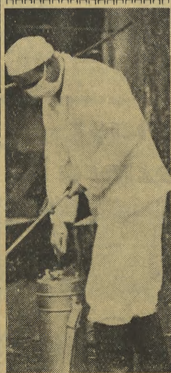
Wypadki zachorowań na ospę naturalną we Wrocławiu postawiły przed służbą zdrowia trudne i odpowiedzialne zadanie. Lekarze, pielęgniarki, ekipy ośrodków zdrowia i personel szpitalny pracują niezwykle ofiarnie. Na zdjęciu: odkazanie odzieży i terenu w punkcie dezynfekcyjnym.

Na konferencji prasowej algierski minister informacji Belahuan powiadomił o działalności „grupy kontroluologicznej”, która ostatnio została unicestwiona w Kablyi. Minister stwierdził, że swego czasu Budiaf nawiązał kontakt z „pewnymi elementami algierskimi i zagranicznymi”. W toku starcia które doprowadziło do rozgromienia grupy, jedna osoba została zabita. Minister widzi w powstaniu grupy „rękę Izraela”.