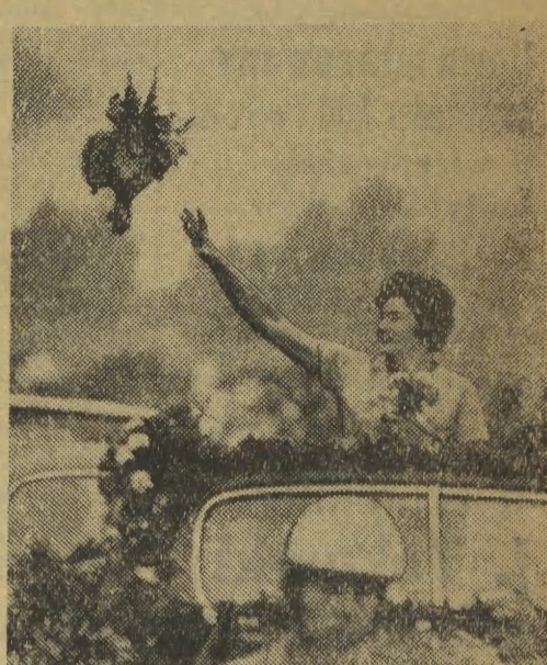
Tierieszkowa przejeżdża ulicami Pragi, serdecznie witana przez jej mieszkańców.

PRAGA Prezydent CSRS, A. Novotny wydał 15 bm. przyjęcie na cześć lotnika-kosmonauty ZSRR, Walentyna Tierieszkowej przebywającej z wizytą w Czechosłowacji. Prez. Novotny nadał W. Tierieszkowej honorowy ty-