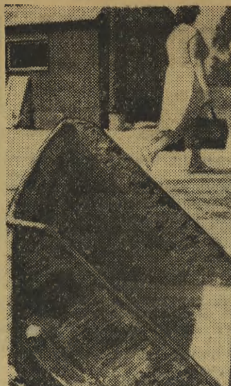
Za nowo wybudowanym SAM-em spożywczym w Czyżynach leży porzucona taka oto koleba, nieuszkodzona i nadająca się jeszcze do pracy. Interesuje nas jak przedsiębiorstwo, które zgubiło ten drobiazg, wyliczy się później ze swojego sprzętu?