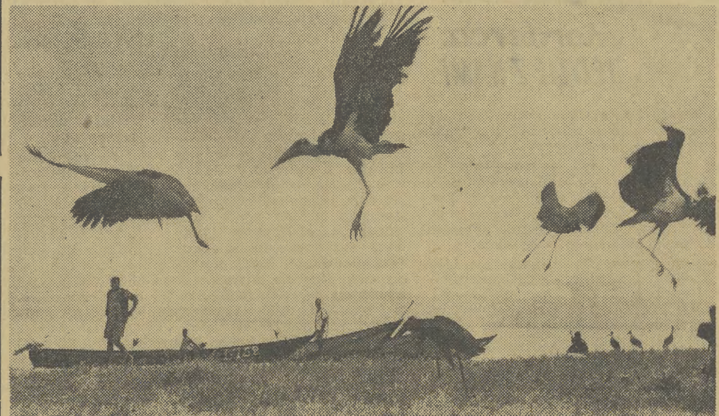
Piękne Jezioro Edwarda w Ugandzie od lat stanowi główne źródło utrzymania okolicznych rybaków. Z odległych miast zjeżdżają tam kupcy w poszukiwaniu ryb, znanych ze swej jakości. Filety z nege, najlepszej z miejscowych ryb, cieszą się doskonałą marką. Dzień w dzień wyruszają rybacy na połowy. Po powrocie, zgodnie z tradycją, przy pomocy rodzin czyszczą i filetują ryby, przygotowując je do handlu. Od niepamiętnych czasów towarzyszy im w tej czynności i skrzętnie pomaga marabut. Ten okazały i żarłoczny ptak sprawnie zbiera wszystkie odpady. Jest tak przyzwyczajony i zgrany w swej pracy z rybakami, że z góry wie co dla niego jest przeznaczone. Dzięki niemu wybrzeże jest zawsze idealnie czyste. Z powodu swej doniosłej roli sanitarnej marabut pozostaje pod ochroną. (db)

...Dawid Ojstrach i Jehudi Menuhin wystąpili razem w Londynie przed 7-tysięczną publicznością, grając jeden z koncertów Bacha. (bk)