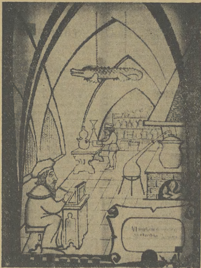
Przypominamy że przy ul. Skarbowej 2 (wejście od ul. Krupniczej) otwarta jest wystawa postępu technicznego w zakładach wielkiej i małej chemii woj. krakowskiego. Na naszym zdjęciu oryginalna plansza „farmaceutyczna”.

Zapytujemy: na co czekać? Chyba na to, aby wzrok dziecka uległ dalszemu pogorszeniu. Wtedy może znaleźć się odpowiednie, mocniejsze szkła. Ale wtedy — dodajmy — trudniej będzie skorygować pogłębioną wadę wzroku. Tak więc problematyczna staje się akcja badań oczu dzieci w szkołach. Po co ją organizować, w jakim celu absorbować czas lekarzy, skoro handel nie dysponuje odpowiednim wyborem szkielec do okularów. (bp)